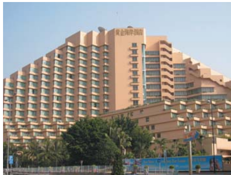
圖23.2 度假酒店：黃金海岸酒店