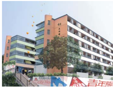
圖23.5 由美荷樓改建而成的城市旅舍設計圖

於1950年代在石硤尾興建的美荷樓已納入首階段活化歷史建築伙伴計劃的七幢歷史建築之一。美荷樓將改建成為城市旅舍，提供129個旅舍住宿單位。城市旅舍同時附設公屋博物館，展示50年代原貌和佈置的公屋樣本單位。