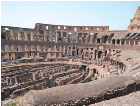
圖 15.5 意大利羅馬鬥獸場

歐洲到處是古城、古蹟和特色文化，每座城市都有自己的博物館、地域文化和藝術設施。大部分宮殿、古堡、教堂、橋樑等古蹟都保存完好，極具欣賞的價值。具體例子有法國的巴黎鐵塔、英國的大英博物館、荷蘭的風車屋、德國的海德堡、意大利的羅馬鬥獸場、雅典古城、匈牙利的布達皇宮、俄羅斯的聖彼德堡和捷克的查理斯大橋。這些都是歐洲有名的人文景觀。