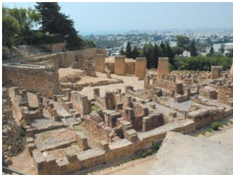
圖 15.10 迦太基城遺址

非洲是孕育世界古文明的搖籃之一，埃及、摩洛哥和突尼斯都是非洲著名的文明古國，現存不少遠古人類文明發展的歷史遺跡。埃及的吉薩金字塔、突尼斯的迦太基城的遺址、南非的旺德偉克山洞和埃塞俄比亞的拉茲貝拉岩洞教堂等都是非洲古代的文明象徵。塞內加爾雷島、加納海岸角和肯尼亞耶穌堡亦是著名的旅遊勝地。