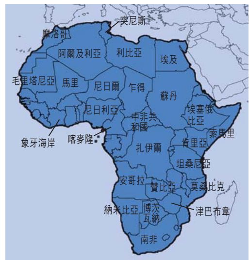
圖 15.7 非洲地圖及部分國家位置