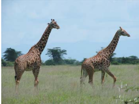
圖 15.8 北非國家動物園

北非地中海沿岸境內珍禽異獸遍佈，天然動物園就有七十多處。非洲大河源遠流長，尼羅河、剛果河、尼日爾河、贊比西河等大河穿越一些高原山地，維多利亞大瀑布則具盛名。