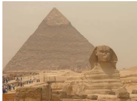
圖 15.11 埃及金字塔