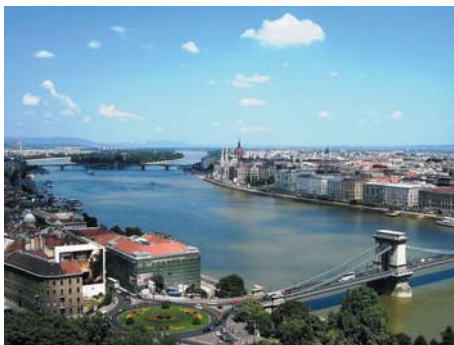
圖 15.3 歐洲著名的河景：多瑙河

歐洲的鄉村(尤其是南歐)到處是森林、牧場、花田和果園。各種自然生態與田園風光和諧統合，園林處處。例如荷蘭的花田遍佈各處，每到花期，全國儼如一個大花園。濃綠的樹林、如茵的草地、湛藍的湖泊、清澈的山澗流水，共同構成了阿爾卑斯山脈的迷人風光。西班牙、希臘和葡萄牙則以美麗的海濱、陽光和沙灘聞名於世，每年夏天都吸引不少旅客來享受日光浴。