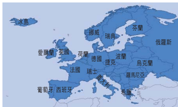
圖 15.2 歐洲地圖及部分國家位置