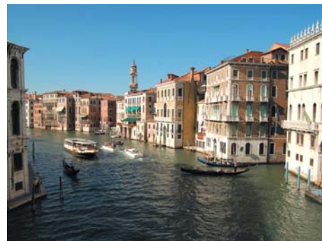
圖 15.4 歐洲著名的水鄉：威尼斯