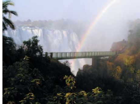
圖 15.9 維多利亞大瀑布