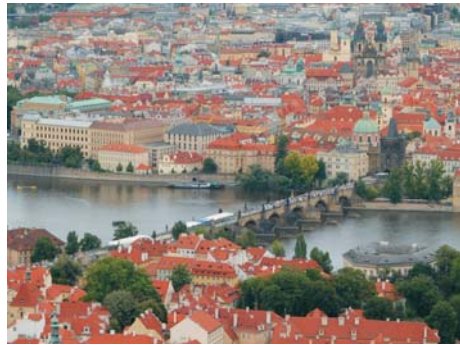
圖 15.6 捷克布拉格查理斯大橋

歐洲在不同的人文資源都極之豐富，例如在政治和經濟方面，比利時的鑽石園地、漢諾威的世界博覽之城、科隆的世界會展之城和瑞士日內瓦的世界國際會議中心每年都吸引大量旅客到訪，參與在當地舉辦的大型政經活動。在文化和社會方面的例子則有被稱為啤酒之都的德國慕尼黑和維也納的音樂廳。以下是部分歐洲國家的著名景點：